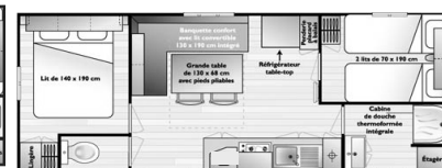
Catégorie 2 : 4 personen bredere